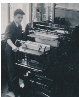
In de drukkerij