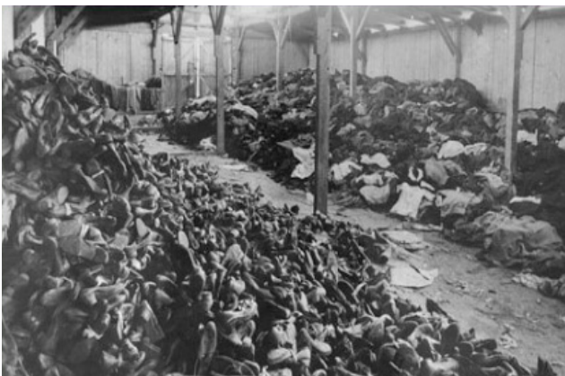
Verzameling kleding en schoenen