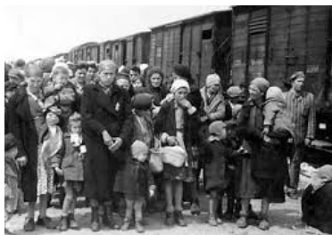
Joden bij hun vertrek uit kamp Westerbork

waren daar ook bij. Snel moesten ze hun spullen inpakken. Naast een tas met kleding en toiletspullen