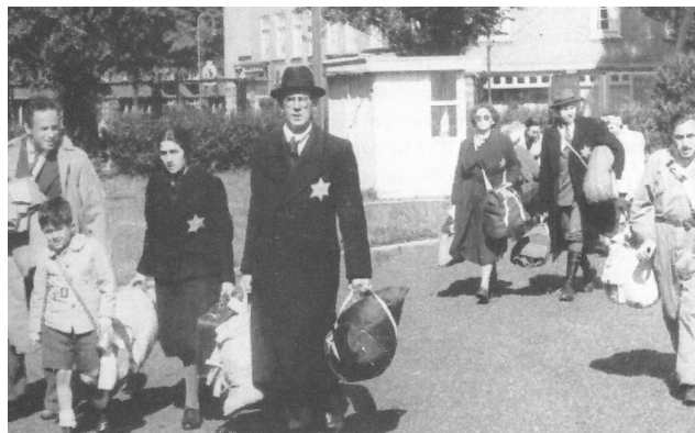
Joden in Amsterdam, op weg naar de trein