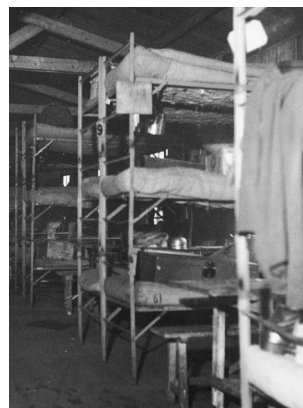
Een barak van binnen