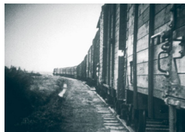
De trein is op weg naar Sobibor